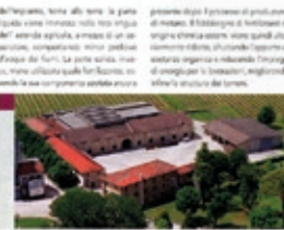
IMMAGINE e sostenibilità

Oltre a questo, l'azienda ha investito in tecnologie avanzate per ottimizzare i processi produttivi e ridurre l'impronta ambientale. La Cantina Principi di Porcia ha investito in tecnologie avanzate per ottimizzare i processi produttivi e ridurre l'impronta ambientale.